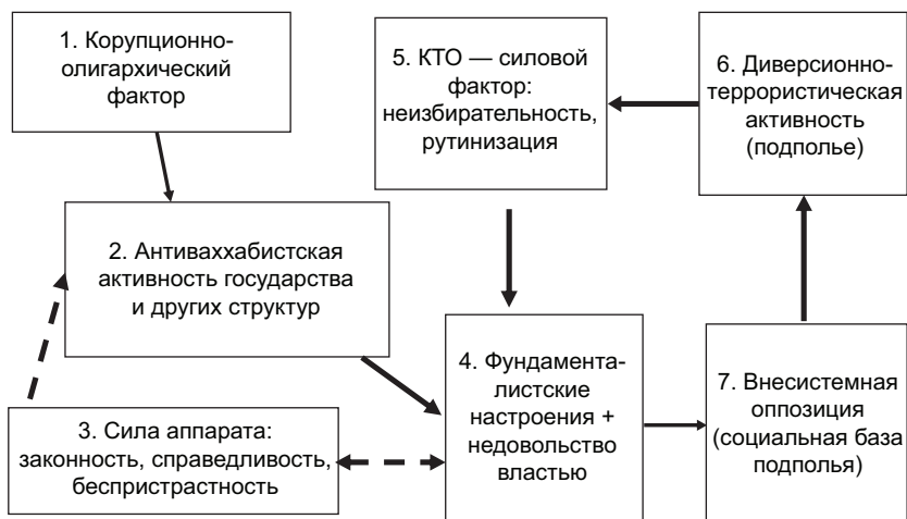
Рис. 1. Модель воспроизводства нестабильности и влияния фактора экстремистского подполья

Примечание к рис. 1. Стрелки «→» означают причинно-следственные (прямые) связи статистического характера: к примеру, чем больше неизбежности, рутинности в реализации контртеррористических операций — КТО (фак-